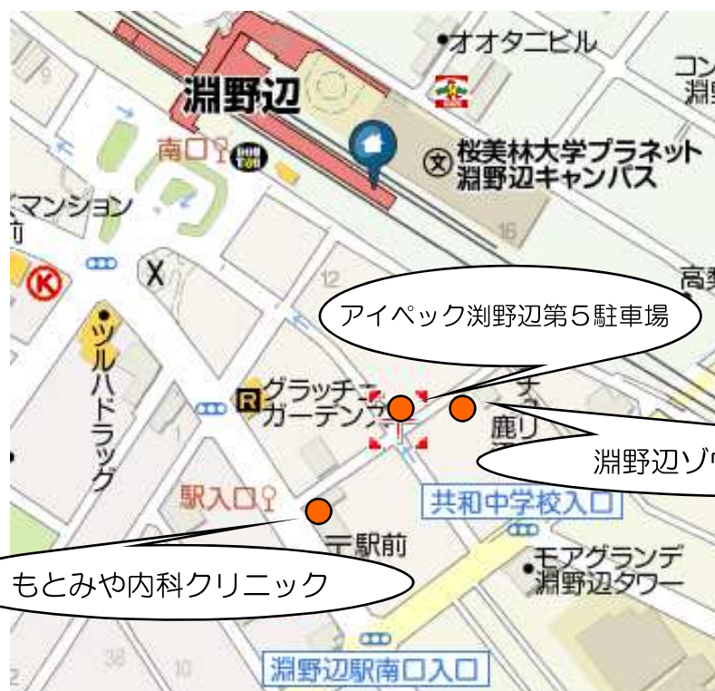
アイパック淵野辺第5駐車場

*こちらの駐車長は、一般の方も利用いたしますので、駐車できない場合もございます。ご了承ください。